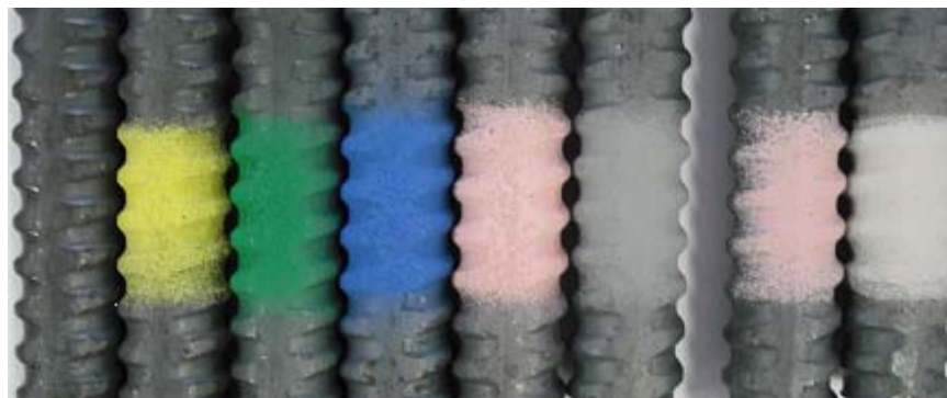
Photo02. カラーマークバー色見本